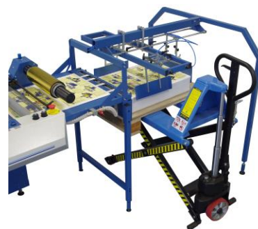
Paletový vykladač - poloautomatický

Dvojice ionizujících tyčí pro vybití statického náboje z polaminovaných archů.