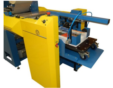
Paletový vykladač - automatický